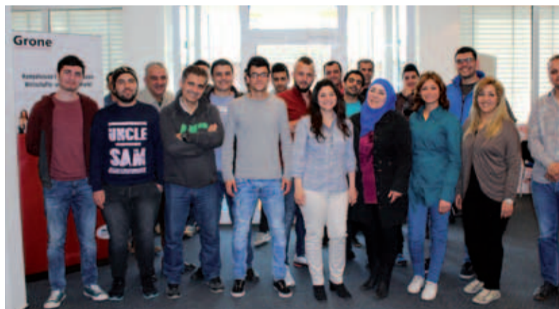
Die Teilnehmer von „First Steps für Migranten“ bei Grone Bremervörde bieten viel Potenzial für Unternehmen, die neue Arbeitskräfte suchen.