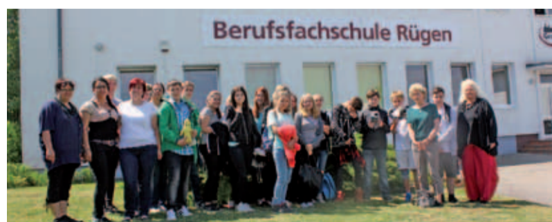
Ein Foto zur Erinnerung: Die Sassnitzer Gäste und Grone-Mitarbeiter vor der Berufsfachschule

Bergen auf Rügen – Schülerinnen und Schüler der Klasse 7c der Regionalen Schule Sassnitz waren zu Gast bei der Grone Berufsfachschule Rügen. An drei Tagen informierten sie sich im Rahmen der Berufsfrühorientierung über soziale Berufe und Berufe im Bereich Gesundheit.