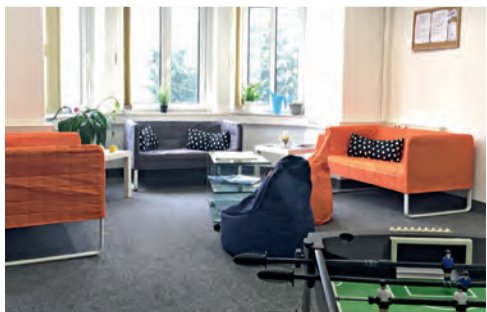
Eine Lounge mit Kickertisch steht allen zur Verfügung

ihrerfolgreicher Vorläuferin Jena (agito 2.0), zielgruppengerecht eingerichtet. Hier finden die Teilnehmenden PC-Arbeitsplätze, WLAN und eine geräumige Lounge mit Kickertisch inklusive kostenloser Getränke. Auf diese Weise wird eine gelöste, kommunikative Atmosphäre geschaffen.