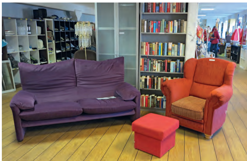
Das Angebot im Ladenlokal mit einer gemütlichen Sitzzecke zum Verweilen

Das sympathische Warenhaus im Herzen Altonas erfreut sich großer Beliebtheit und ist im Laufe der Jahre zu einer bekannten Institution in Hamburg geworden. Menschen mit geringem Einkommen können im WarenGut Dinge des alltäglichen Lebens zu besonders günstigen Konditionen erwerben. Möbel, Einrichtungsgegenstände, Elektroartikel, Kleidung, Haushaltswaren und Medien finden sich auf ca. 300 Quadratmetern Verkaufsfläche. Dank großzügiger Spenden stehen auch schon mal ein Klavier, ein Akkordeon oder andere wertvolle Musikinstrumente im Warenangebot.