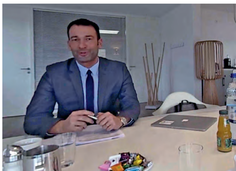
Der Bewerbende (Anwendende) sitzt dem Interviewpartner direkt gegenüber

Ab Sommer 2019 soll das Bewerbungstraining via VR-Brille auch an anderen Grone-Standorten umgesetzt werden, um die Bildungsangebote im Zuge der Digitalisierung mithilfe des Einsatzes innovativer Methoden anzupassen und zu verbessern.