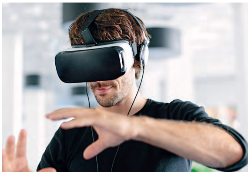
Eine VR-Brille ermöglicht ein reales Eintauchen in eine digitale Welt

Nach Beendigung der Testphase wurden die Ergebnisse mit der Firma twinC besprochen und die App an die Anforderungen von Grone angepasst.