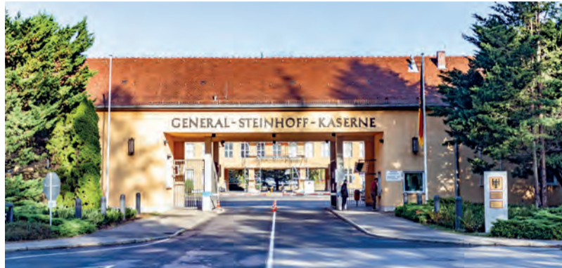
Der Schulungsort in der General-Steinhoff-Kaserne in Berlin-Gatow

Berlin – Mit seinem Team bildet er seit September 2014 für die Grone-Bildungszentren Berlin GmbH – gemeinnützig – junge Zeitsoldatinnen und Zeitsoldaten in der General-Steinhoff-Kaserne in Berlin-Gatow aus. Die Ausbildung der Kaufleute für Büromanagement wird über den Berufsförderungsdienst der Bundeswehr (BfD) finanziert. Auf diese Weise bedankt sich die Bundeswehr für die Aufopferung der Soldatinnen und Soldaten für den Dienst am Staat und schafft eine Grundlage für die berufliche Zukunft nach der Dienstzeit. Gleichzeitig nutzt sie das wirtschaftliche Know-how der Soldatinnen und Soldaten für die Arbeit in der Bundeswehr. So werden die späteren Kaufleute in den Schwerpunkten „Einkauf und Logistik“ sowie „Personalwirtschaft“ ausgebildet. Die überdurchschnittlich guten Prüfungser-