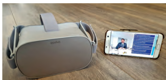
360-Grad-Bewerbertraining mit VR-Brille und Partner-App

Die Potenziale bezüglich des Einsatzes von VR-Brillen wurden auch im durchweg positiven Feedback der Teilnehmenden deutlich. Die moderne und von vielen noch nie erlebte Technik sorgt demnach für eine gesteigerte Aufmerksamkeit, für eine bessere Verständlichkeit der Lerninhalte sowie größere Lernmotivation und Neugierde.