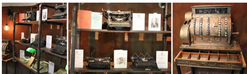
Die liebevoll zusammengetragene kleine Grone-Ausstellung in Hamburg-Hammerbrook

Hamburg – Die Hausverwaltung des Grone-Bildungszentrums in Hamburg-Hammerbrook überraschte Beschäftigte, Teilnehmende sowie Lehrkräfte kürzlich mit einem eindrucksvollen Aufbau im Untergeschoss des Gebäudes. Auf nur wenigen Quadratmetern wurde aus einem Regalgerüst, gefertigt aus alten Rohrleitungen und einer Echttrostwand, eine Miniaturausstellung errichtet, um das traditionsreiche Unternehmen Grone und seine lange Historie zu repräsentieren.