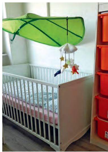
Die liebevoll gestalteten Räume für die Kinder im GRÖNCHEN Koblenz

Betreuung an die individuellen Bedarfe der Eltern im Rahmen des Maßnahmenablaufs angepasst.