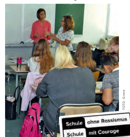
Eine Schulklasse in Berlin-Treptow

Auch den Lernenden des Bildungszentrums in Treptow war es ein großes Anliegen, eine „Schule ohne Rassismus und eine Schule mit Courage“ zu sein. Dafür wurden unter der Schülerschaft und den Lehrkräften Interviews rund um die Themen Rassismus und Mobbing durchgeführt. Diese wurden mit einem Mikrofon aufgenommen und