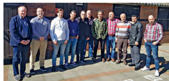
Die Teilnehmergruppe in Nordhorn

Grundkompetenztraining zur besseren beruflichen Integration mit digitalen Inhalten